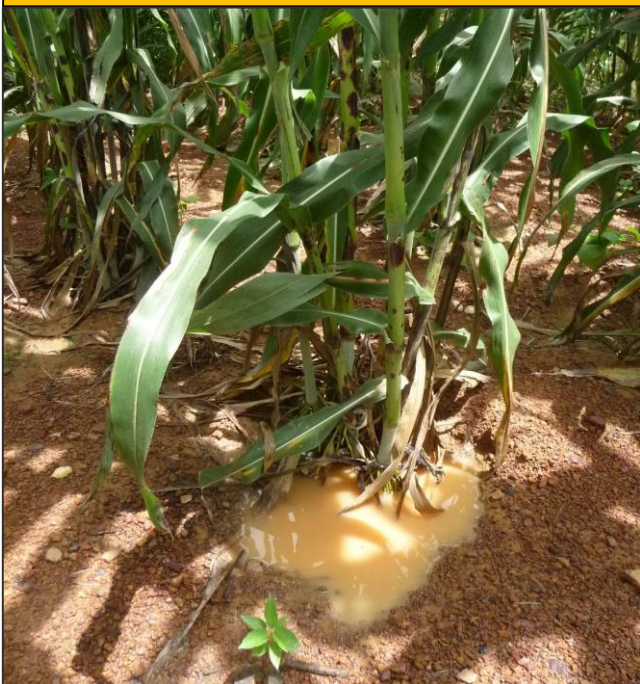
Culture du sorgho en Zai

Les discussions se poursuivent pour l'implantation du périmètre. Il faut veiller à la qualité et l'accessibilité des terrains, ainsi qu'à ménager le droit coutumier. Le début des travaux est prévu pour février 2016.