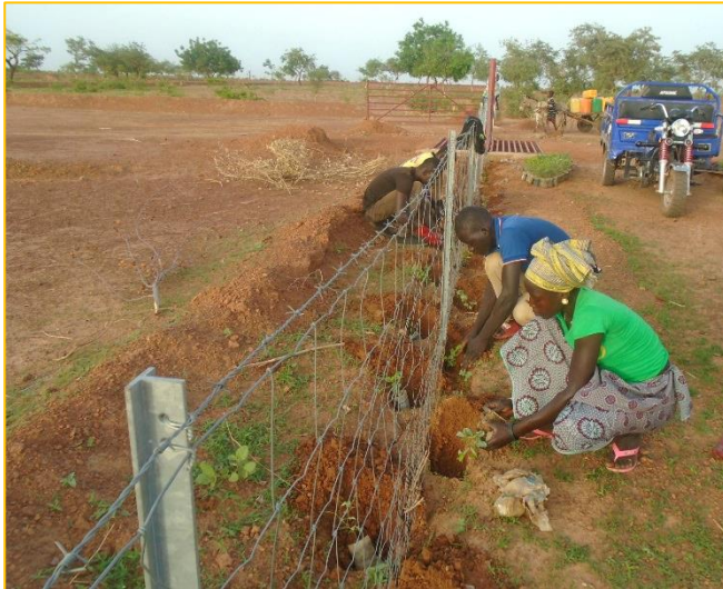
Plantation de la haie

à Guié, permettent de définir le tracé et d'éviter que des constructions ne viennent s'implanter sur le trajet.