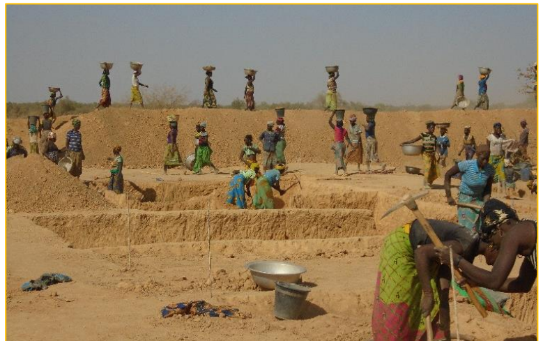
Creuse des mares et construction du barrage