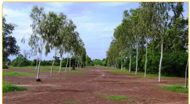
Exemple de route boisée à Guié

D'ici la fin de l'année, on va finir d'aménager les 5% restants, c'est-à-dire 4 lots de 4 parcelles chacun, de creuser des trous pour les arbres d'axes (fruitiers) et les arbres de mare dans chaque parcelle. On doit aussi implanter la route boisée qui va relier le village au périmètre; les arbres qui bordent la route, comme ci-dessous