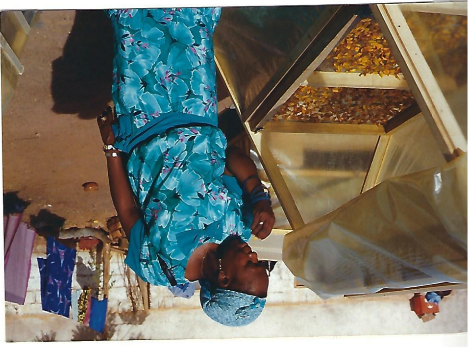
Sécherie en séchage pour le séchage des légumes

On apprend à sécher les légumes ou les fruits par des moyens simples. Soit, coupe, et mettre en tas, le haut recouvert de plastique et bien couvrir et sécher du soleil fait le reste! (environ 3-4 jours pour sécher)