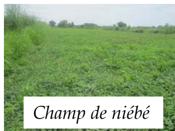
Champ de niébé

Le pâturage rationnel à la clôture électrique a été effectué à la ferme avec une quarantaine de bœufs appartenant à des éleveurs peulhs.