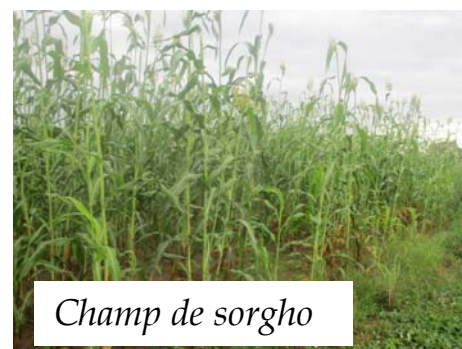
Champ de sorgho

A Goèma , les pluies d'août ont été abondantes et bien réparties tout au long du mois. Ce qui a permis un bon développement des cultures. Dans les champs d'essais, le sorgho et le niébé sont au stade floraison et formation de graines.