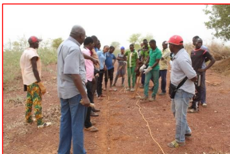
Formation (phase pratique) sur le concept « nourrir ta famille »

À l'issu d'une formation sur le « concept nourrir ta famille », nous avons entamé le creusage des poquets dans notre champ d'essai.