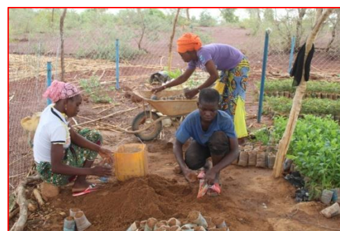
Remplissage des pots