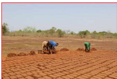
Confection des briques en banco

Les travaux de constructions se poursuivent avec la confection des briques puis la construction du 5 ème logement visiteurs (5m/5m).