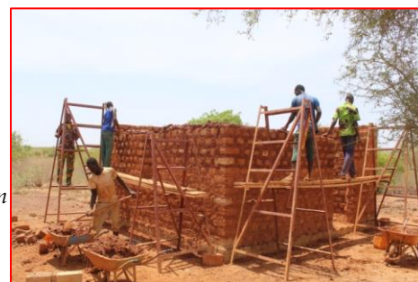
Construction du 5 ème logement visiteur