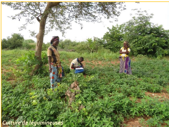
Culture de légumineuses

Ci-dessous, quelques photos qui illustrent l'évolution dans le périmètre de Landao.