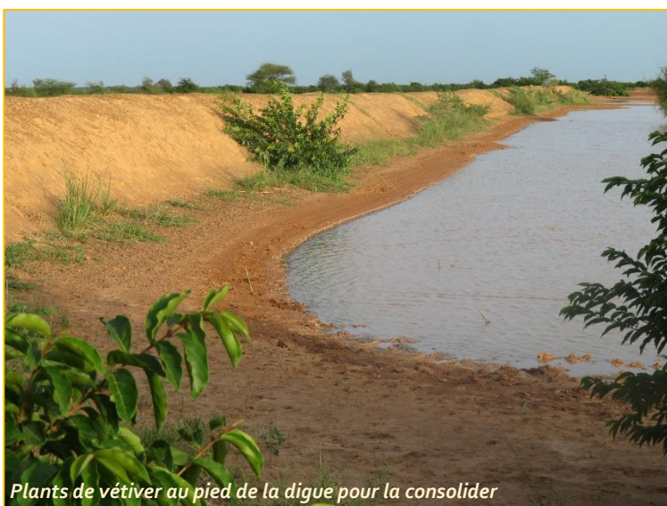
Plants de vétiver au pied de la digue pour la consolider