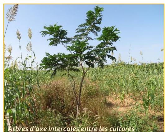
Arbres d'axe intercalés entre les cultures