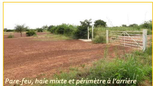
Pare-feu, haie mixte et périmètre à l'arrière