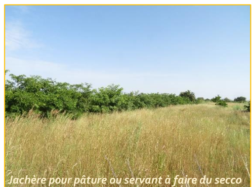
Jachère pour pâture ou servant à faire du secco