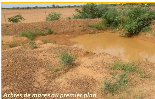
Arbres de mares au premier plan

Parallèlement, l'Initiative de la grande muraille verte pour le Sahara et le Sahel (IGMVSS) collabore avec des ONG dont TERRE VERTE, des collectivités, les populations et des associations qui ont pour cheval de bataille la récupération des terres dégradées et le reverdissement du Burkina Faso. A l'origine, il s'agissait d'ériger une barrière d'arbres longue de 7000 km environ sur une largeur de 15 km allant de Dakar à Djibouti. Désormais, cette idée a évolué. Il s'agit maintenant pour chaque pays, au lieu d'ériger un mur de végétation, de conceptualiser plutôt l'Initiative en fonction des réalités du terrain. Le Burkina Faso a décidé de mettre l'accent sur la récupération des terres dégradées à travers la technique du zaï, des cordons pierreux et de l'agroforesterie. On assiste ainsi à une prise de conscience qui se matérialise par des campagnes de reboisement dans tout le pays.